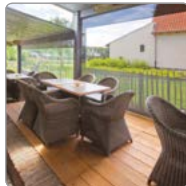
Crystalvenster in glasvezeldoek